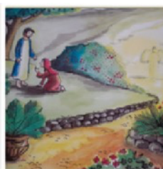
Jezus leeft Pasen