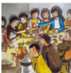
Het Laatste Avondmaal Witte Donderdag