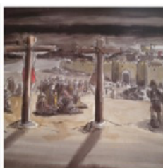
Jezus sterft aan het kruis Goede vrijdag